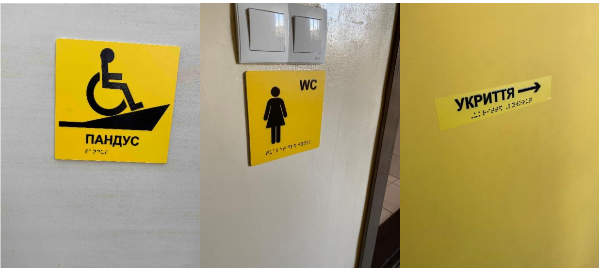
Комунальний заклад "Чернігівський ліцей" Чернігівської обласної ради