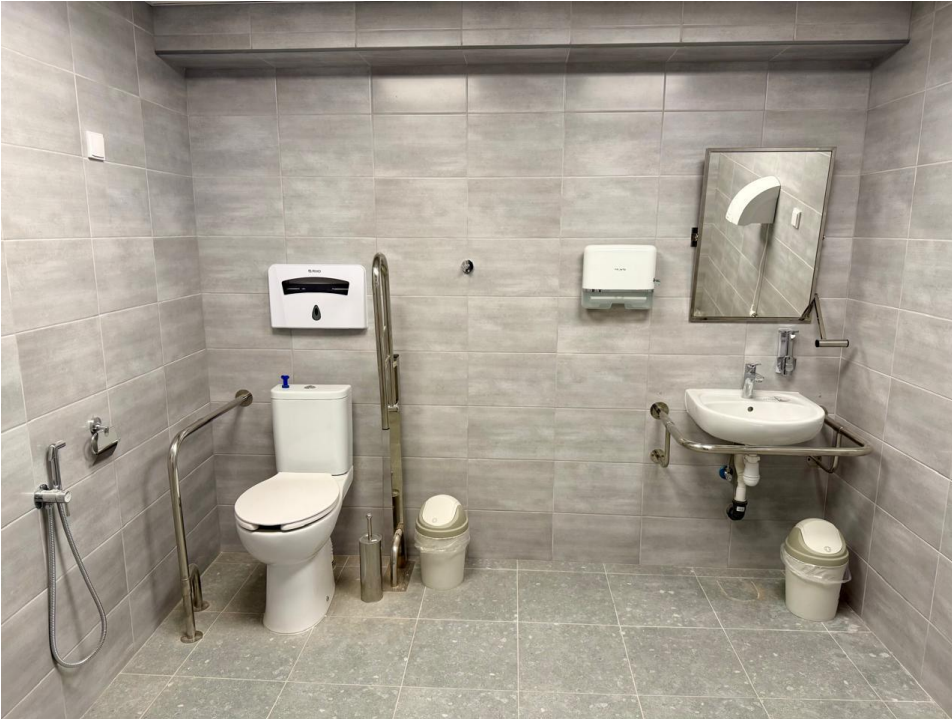
Чернігівська гімназія № 33 Чернігівської міської ради