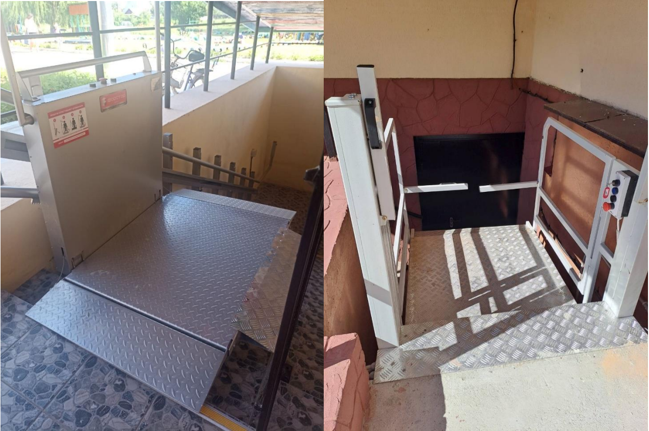
Носівський дошкільний навчальний заклад №1 "Барвінок" комбінованого типу Носівської міської ради Чернігівської області