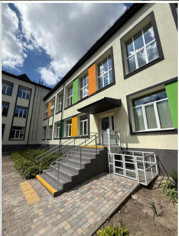
Чернігівська гімназія № 20 Чернігівської міської ради