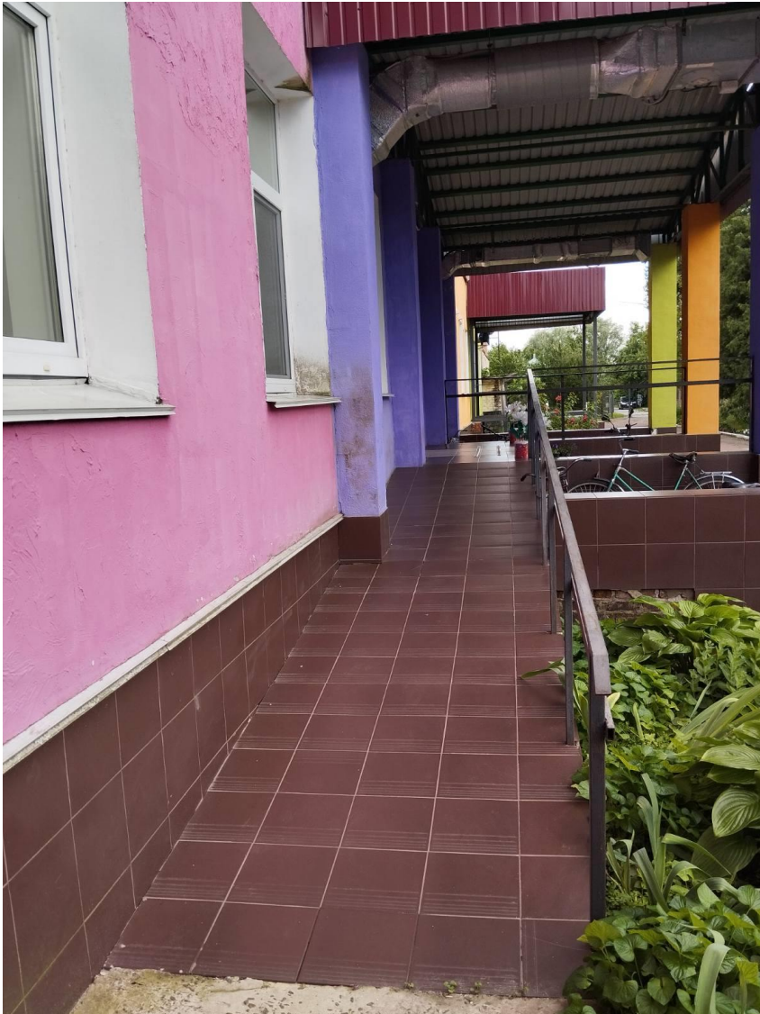
Ніжинська гімназія № 14 Ніжинської міської ради Чернігівської області